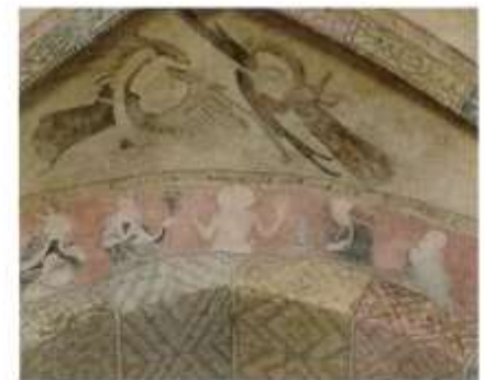
Auferstandener Christus, Gewölbemalereien von ca. 1400, St.-Just-Kirche, Restaurierung 2017 / 2018