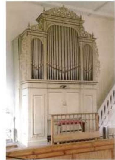
Carl-Eduard-Jehmlich-Organ von 1882, St.-Just-Kirche, Restaurierung geplant 2019